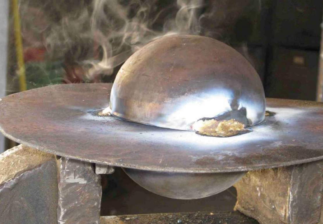
Abb. 9: Planetenparade. Die runderneuerten Planeten warten in der Werkstatt darauf, in ihre Umlaufbahnen gesetzt zu werden (Mai 2016)