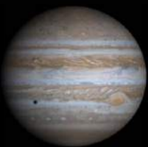
Bild der Raumsonde Cassini, NASA. Der Jupitermond Europa wirft seinen Schatten auf die Wolkenoberfläche des Planeten.

Durchmesser: ca. 142.800 km Entfernung zur Sonne: ca. 778 Millionen km Rotationsgeschwindigkeit: 9 Stunden 55 Minuten 30 Sekunden Umlauf um die Sonne: 11,86 Jahre Durchmesser im Modell: 12,7 cm Entfernung zum Sonnenmodell: 346 m