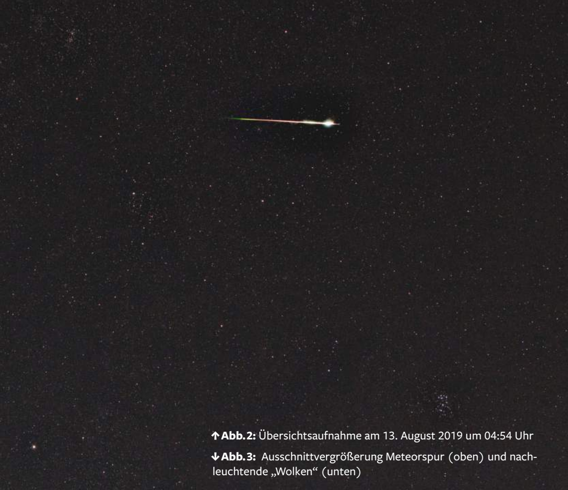
↑ Abb.2: Übersichtsaufnahme am 13. August 2019 um 04:54 Uhr