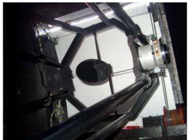
Das neue Newton-Teleskop. Links: Blick von vorne auf den Hauptspiegel. Rechts: Blick zum Fangspiegel und auf die beiden Ausgänge.

Zur Deklinationsverstellung. Nach den schlechten Erfahrungen, die wir in der Westkuppel mit einem Schneckenrad machen mussten, entschieden wir uns für eine Vorrichtung mit einem Hebelarm, die eine definitiv spielfreie Korrektur in Deklination