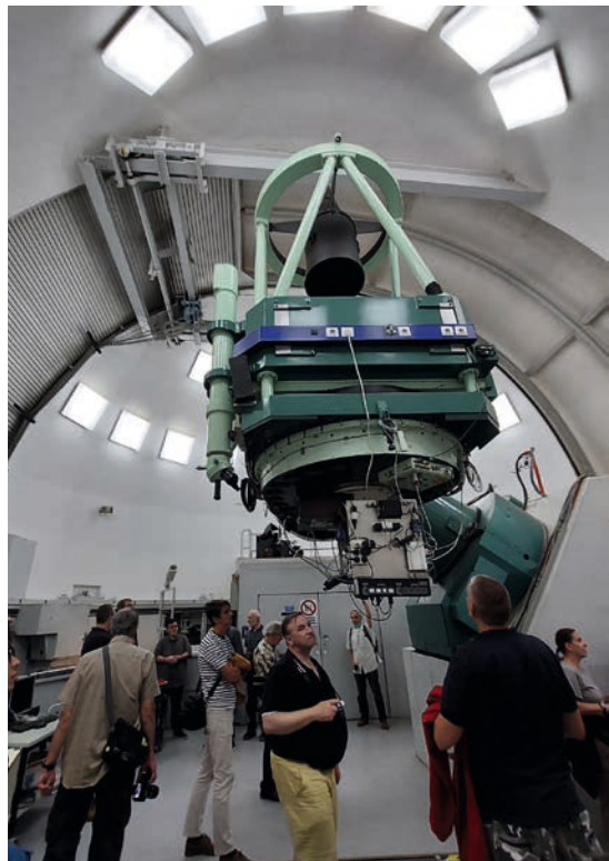
Abb. 4 (unten): Der 1,23 m-Spiegel (seit 1975)