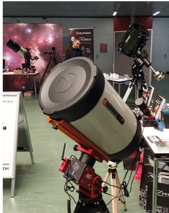
... und die größten Spiegelteleskope in der Ausstellung.