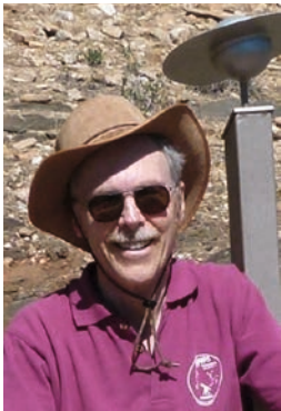
Rainer Glawion Redaktion SFB Mitteilungen

A ufbruch und Rückblick – das Jahr 2023 ist ein ganz besonderes Jahr für unseren Verein. Wir blicken auf 50 Jahre Vereinsgeschichte zurück und starten mit einem erneuerten Vorstand in eine neue Zeit unserer Vereinsgeschichte. Unser Jubiläum (50 Jahre SternfreundeBreisgau 1973-2023) feiern wir im Lauf dieses Jahres an mehreren Orten (Planetarium,