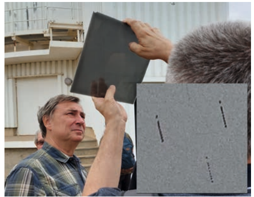
Abb. 5a-c: Der 1,20 m Schmidt-Spiegel. Das Schmidt-Teleskop mit 80 cm Eintrittsöffnung und 1,20 m Spiegeldurchmesser (mit CCD-Sensor wieder in Betrieb). Dieses ursprünglich ab 1954 an der Hamburger Sternwarte betriebene Teleskop wurde 1975 auf den Calar Alto mit seinen besseren Wetterbedingungen gebracht. f = 2,4 m, Plattengröße 8'' \times 10'' . Was mich hier in hohem Maße beeindruckt hat, ist die alte noch vorhandene Schmidt-Platte mit einer Fokus-Serie zum Fokussieren. Der Ausschnitt rechts unten im oberen Bild wurde mit dem Smartphone gegen den hellen Himmel aufgenommen.