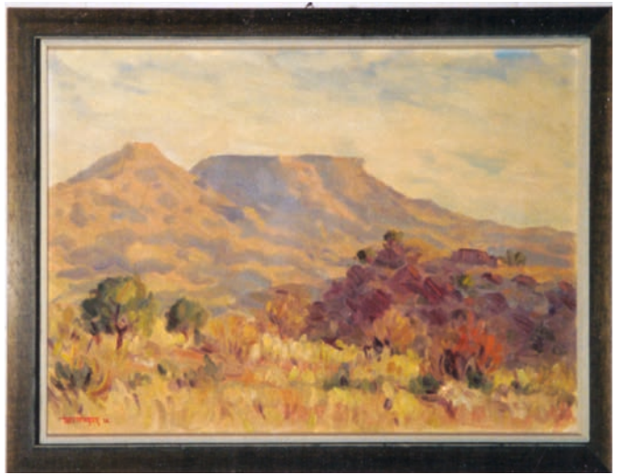
Abb. 1: Das Gamsbergbild im damaligen Arbeitszimmer von Prof. Hans Elsässer

Abb. 2: Der 3,5 m-Spiegel (seit 1984), das größte Spiegelteleskop in Westeuropa. Am Bau waren unter anderem die Firmen Schott (Zerodur) und Zeiss beteiligt.