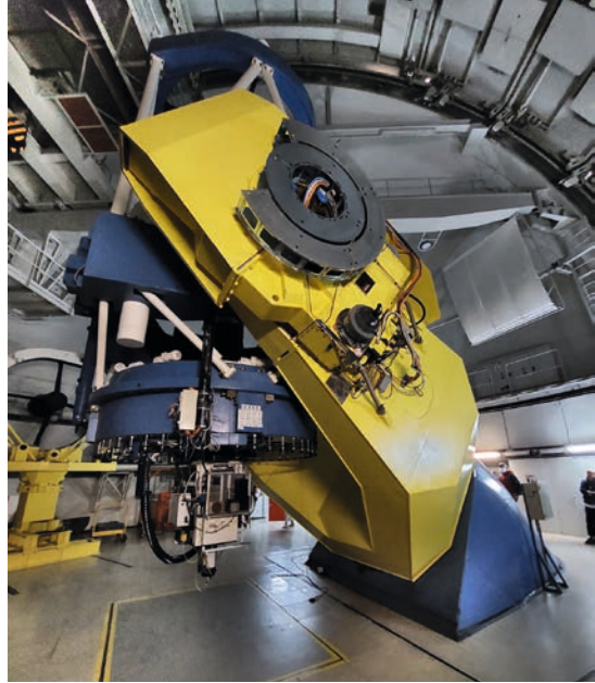
Abb. 3 (oben): Der 2,23 m-Spiegel (seit 1979)

Der Dienstag nach der Tagung war der berühmten Alhambra (arabisch für Rote Burg) in Granada gewidmet. Den Mittwoch haben meine Frau und ich dann für die Stadt und für das Museo Cuevas del Sacromonte genutzt. Dort lebten und arbeiteten 500 Jahre lang bis um 1970 Gitanos in den noch erhaltenen Felshöhlen (s. Google!). – Diese primär astronomische Reise nach Granada hat uns motiviert, für das nächste Frühjahr gleich mal eine Andalusien-Reise zu buchen, nochmal Granada, dann Ronda, Cordoba, Sevilla und Gibraltar.