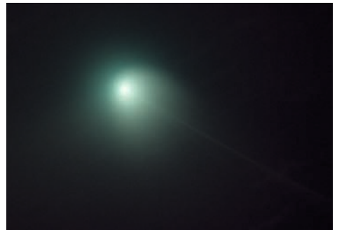
Ein Stack des Kometen aus 23 Aufnahmen lässt den geteilten Plasmaschweif erkennen. Aufnahmen vom 29.01.2023.