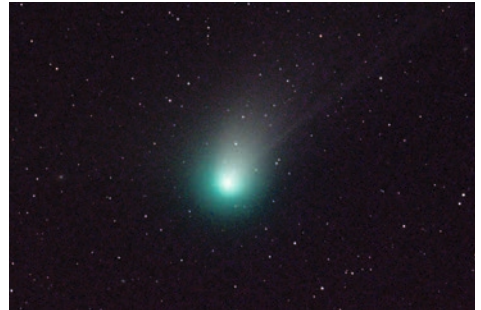
Ein Stack von 5 Aufnahmen lässt den Schweif erkennen. Aufnahmen vom 17.01.2023.